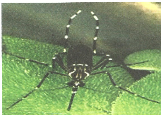
埃及斑蚊 胸部背側有一對彎曲