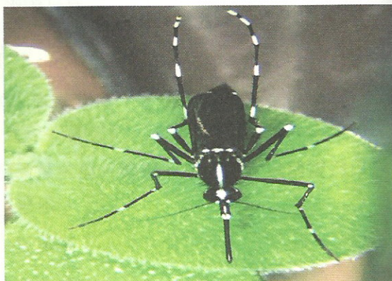
白線斑蚊 胸部背面有一條白線條紋及中間兩條縱線